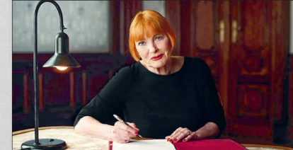
Chris Löhner, TV-Legende & ehrenamtliche Botschafterin, möchte mit ihrem Vermächtnis Gutes tun und bedenkst Jugend Eine Welt in ihrem Testament.