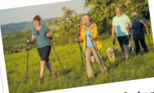
„Geduldig, friedlich, locker – mit dem richtigen Rhythmus und der richtigen Ausrüstung.“