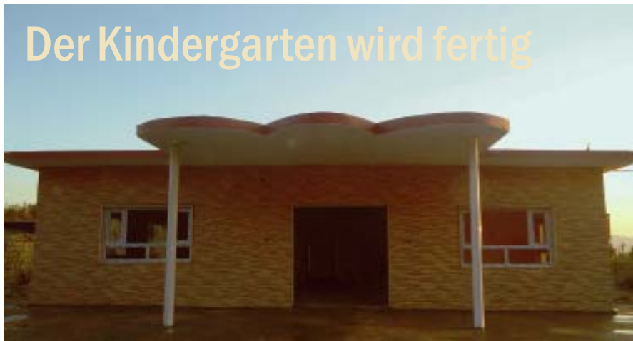
Die Vorderfront des neuen Kindergartens in Enishke.

Enishke – Erst im vergangenen Mai hat man mit dem Bau des Kindergartens begonnen, jetzt ist der Bau fertig. Das Foto stammt vom 25. Oktober, da fehlte noch die Haustür, die zur schön gestalteten Fassade passen muss, und die Inneneinrichtung. Auch um das Haus herum muss noch Erde aufgeschüttet und in dem großen Garten ein Rasen angelegt werden. Diese Arbeiten werden zum Teil erst im Frühjahr gemacht werden können, denn das Dorf liegt fast auf 1000 m Seehöhe und hat einen strengen Winter, für gewöhnlich mit viel Schnee. Die Finanzierung der noch ausstehenden Arbeiten ist dank einer größeren zweckgebundenen Spende gesichert.