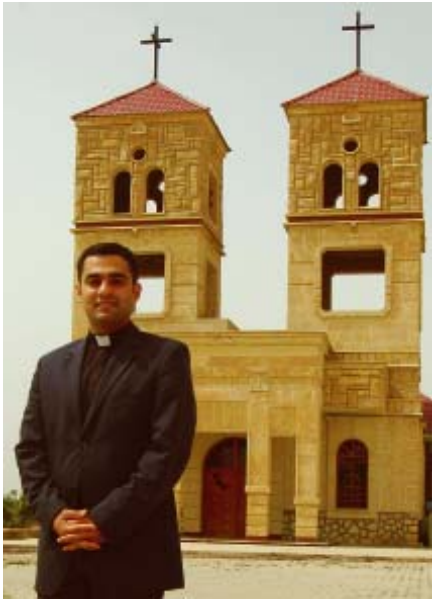
Neupriester in Ankawa.