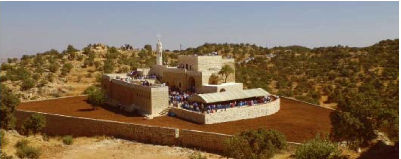
Das renovierte Kloster Mor Yakub von Karno mit neuem Kirchturm und Gartenfläche während der Eröffnungsfeiern im August 2013.