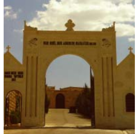
Hinter diesem Eingang zum Hobel und Abraham Kloster kam es zur Schlägerei.

Ähnlicher Vorfall im Mai. Die Christen sind beunruhigt. Denn erst im Mai war Ähnliches vorgefallen (ICO berichtete in Nr. 51). Damals kamen die Aggressoren aus Batman (Hauptstadt der gleichnamigen Provinz), dieses Mal aus Yesilli, eine Stadt in der Nähe von Mardin. In beiden Fällen wurden der Polizei Aufnahmen von der Überwachungskamera übergeben. ■