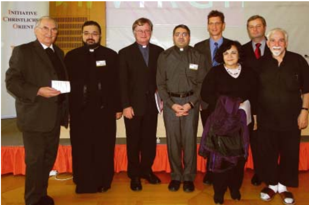
Organisatoren und Referenten der 16. Tagung der „Initiative Christlicher Orient“ am 23./24. September 2013 im Bildungshaus St. Virgil in Salzburg.