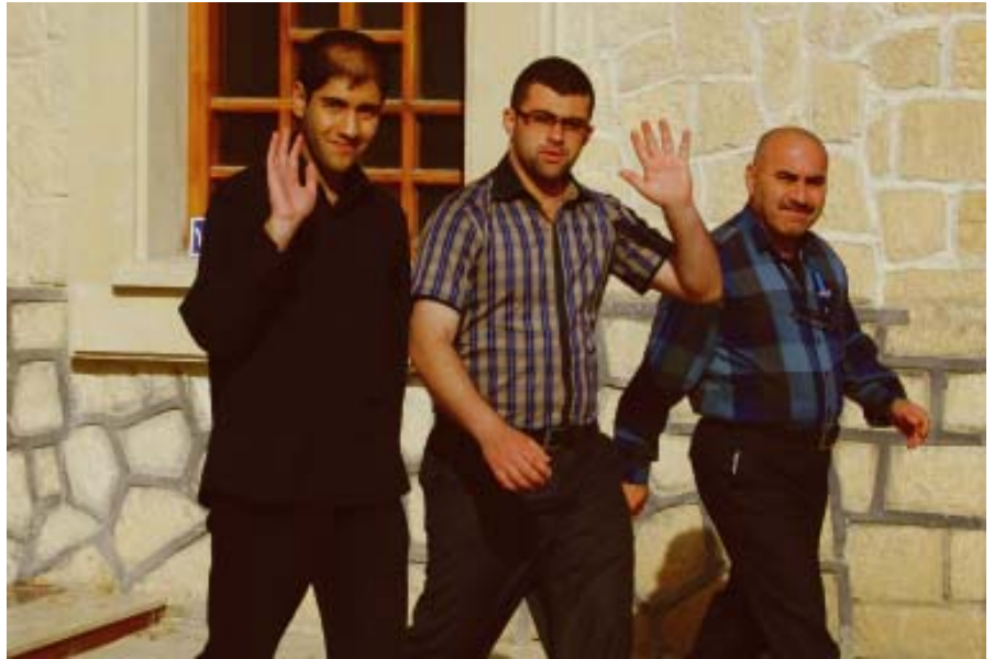
Seminaristen in Ankawa.