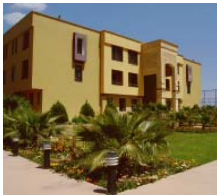
Chaldäisches Priesterseminar in Ankawa.

Studienabschnitt können die Studenten zur Fortsetzung der Studien auch nach Rom entsandt werden.