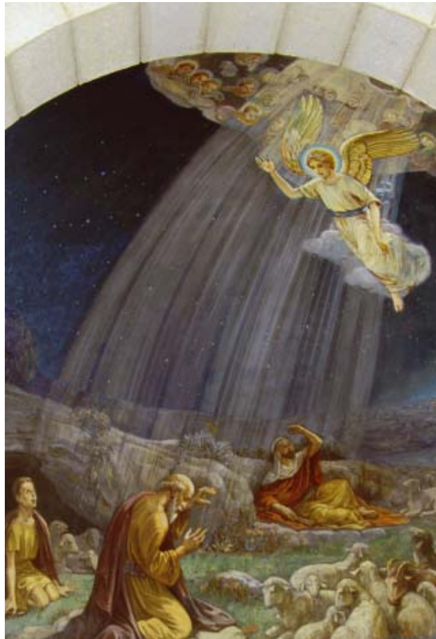
Die Verkündigung an die Hirten in der kath. Kirche.

Beit Sahour ist eine Stadt unmittelbar östlich von Bethlehem. Der Name bedeutet „Haus der Nachtwache“ in Anlehnung an den biblischen Bericht von den Hirten, die Nachtwache hielten bei ihrer Herde. Beit Sahour hat 15.000 Einwohner, von denen 80% Christen und 20% Muslime sind. Es gibt zwei Ländereien, die Hirtenfelder genannt werden: der eine Platz wird von der Griechisch-Orthodoxen Kirche, der andere von den Katholiken (Franziskanern) verwaltet.